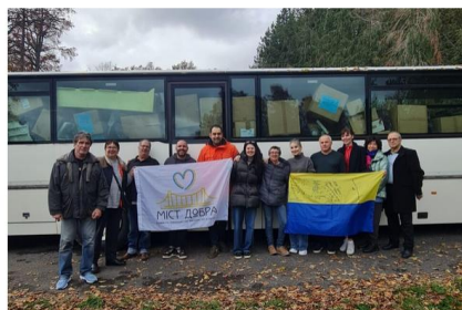
Le car, qui a été récupéré à Brest, s'est arrêté la semaine dernière dans le Vignoble nantais pour le chargement de matériel médical. Il est reparti depuis pour l'Ukraine.

Par Vincent Malbonif Publié le 29 Nov 23 à 9:16